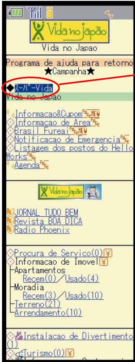
トップ画面 (イメージ)